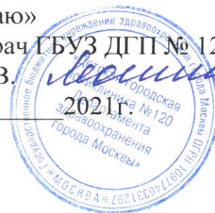
График работы медицинского персонала по адресу: г. Москва, ул. Салтыковская, д. 13В ГБОУ Школа № 2127 на 2020 – 2021 учебный год.